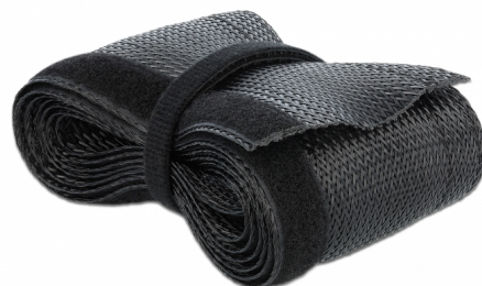
Ø 32 mm / 2 m

Mit Hilfe eines Heißschneidegerätes kann die Länge des Geflechtsschlauches individuell gekürzt werden.