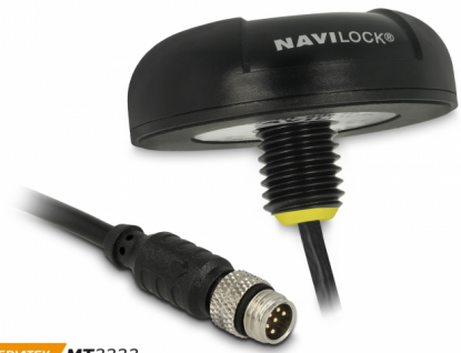
MEDIA TEK MT3333

Der M8 seriell Multi GNSS Empfänger mit dem MT3333 Chipsatz besitzt eine eingebaute aktive Antenne. In Verbindung mit einem Notebook und der entsprechenden Navigationssoftware ist eine Navigation möglich. Der M8 Universalanschluss ist wasserdicht und ermöglicht die Verwendung von optionalen Anschlusskabeln mit vielen verschiedenen Konnektoren. Der GNSS Empfänger kann mit Hilfe des beiliegenden Befestigungsmaterials auf diverse Fahrzeugdächer (PKW, LKW, Bus etc.) montiert werden. Somit fügt er sich mit seiner Gehäuseform unauffällig in das Fahrzeugkonzept ein.