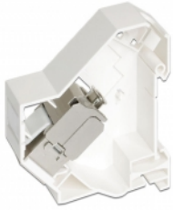
Anwendungsbeispiel mit Stecker