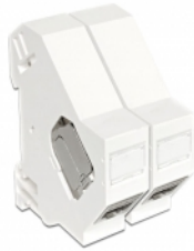
Anwendungsbeispiel mit Stecker