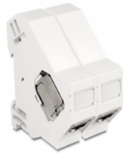
Anwendungsbeispiel mit Stecker