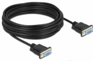
mini Sub-D 9